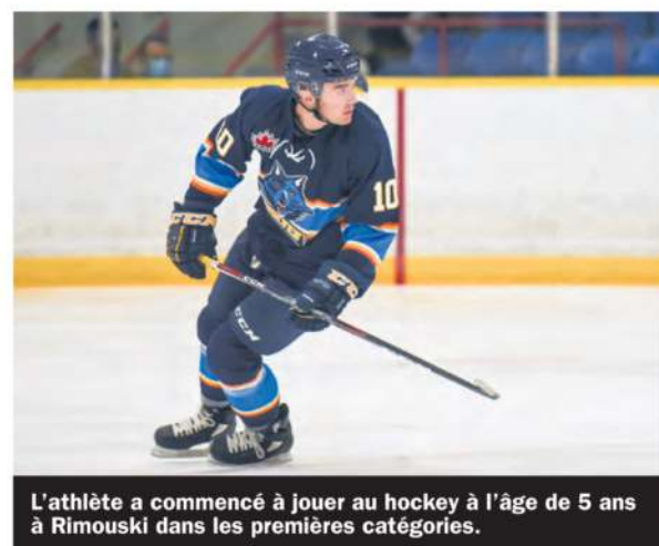
L'athlète a commencé à jouer au hockey à l'âge de 5 ans à Rimouski dans les premières catégories.