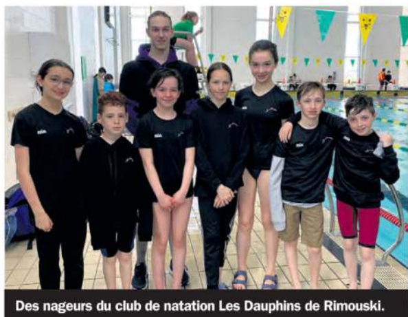
Des nageurs du club de natation Les Dauphins de Rimouski.

Les nageurs des relais mixtes 4 x 50 m libre et quatre nages «15-17 ans» ont battu les 2 records de l'Est-du-Québec dans ces catégories.