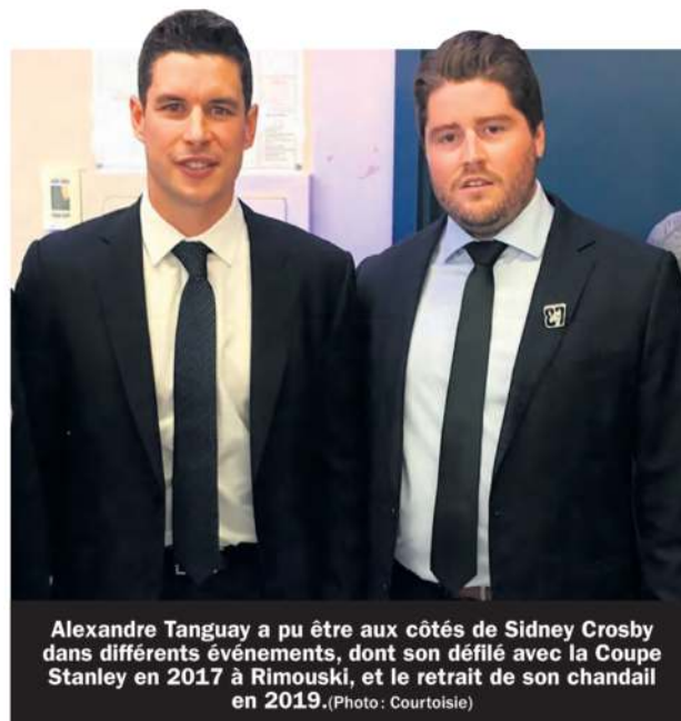
Alexandre Tanguay a pu être aux côtés de Sidney Crosby dans différents événements, dont son défilé avec la Coupe Stanley en 2017 à Rimouski, et le retrait de son chandail en 2019.

Aujourd'hui à la tête de l'organisation, Alexandre Tanguay a pu être à ses côtés dans différents événements, dont son défilé avec la Coupe Stanley en 2017 à Rimouski, et le retrait de son chandail en 2019. «Ce fut un beau moment qu'on a pu partager avec Sidney et ça démontre tout l'amour qu'il a pour notre organisation et à quel point il a apprécié son passage chez nous», a-t-il souligné.